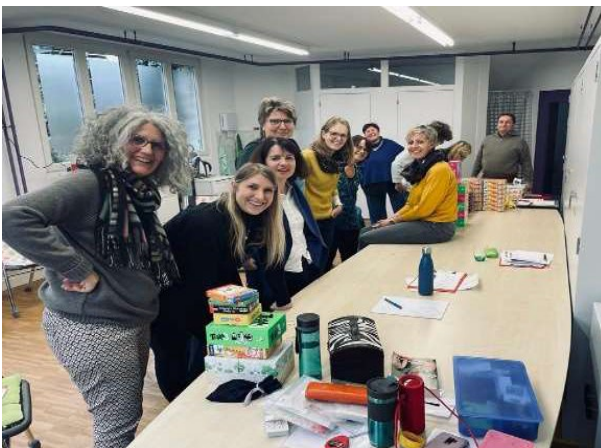
Teaminterne Weiterbildung mit Knocheleien dabei